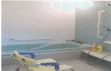
入浴室 ※個別入浴サービス