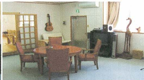
食堂兼機能訓練室